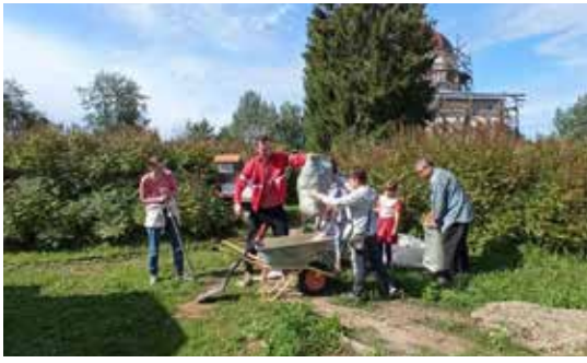
На одном из субботников