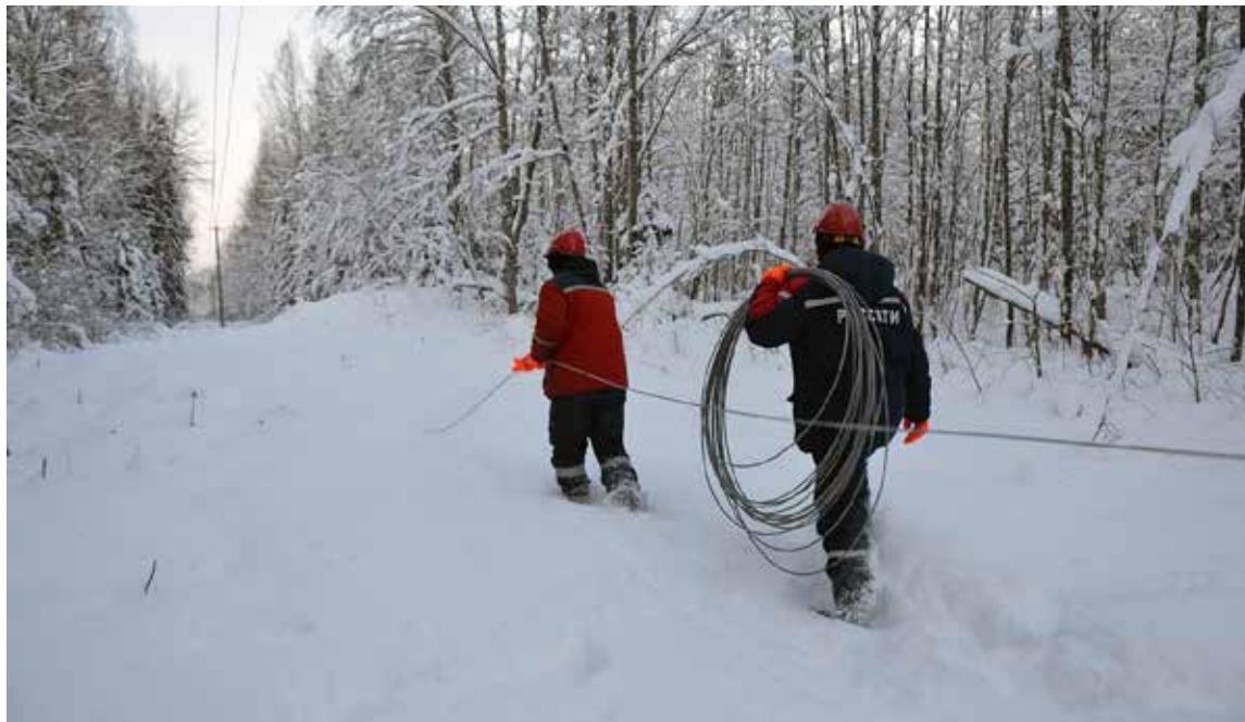
По территории Северо-Запада в декабре прошло несколько циклонов с ледяными дождями и снегопадами, что вызвало перебои в подаче электроэнергии