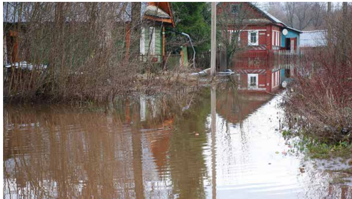
Система датчиков контроля уровня воды поможет людям подготовиться к подтоплению, в том числе поднять запасы провизии из подвалов

менно получать данные о приближающемся подтоплении.