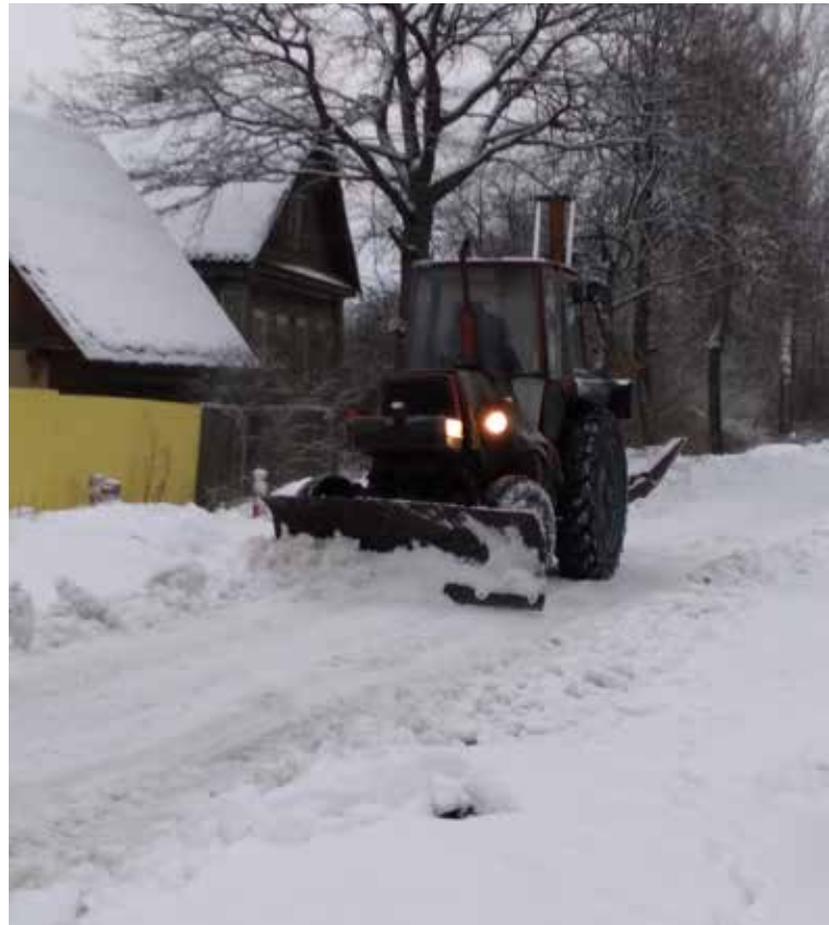
Очистка улиц от снега волнует многих маловишерцев

Посмотреть полную запись прямого эфира можно и сейчас на странице администрации района ВК. Далее — подробные ответы на часто встречающиеся вопросы.